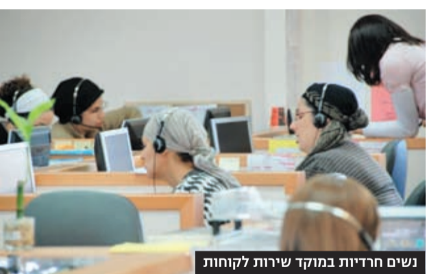
נשים חרדיות במוקד שירות לקוחות

אנחנו נותנים התייחסות מיוחדת כשצריך", אומרת שלגי. "נושא החופשות מתנהל קצת אחרת ואנחנו מאפשרים להן לצאת מוקדם יותר בערבי חג ובימי שישי. מצד שני, בכל הקשור לדרישות העבודה ההתייחסות זהה והן עומדות בהן בכבוד". האם מסלולי הקידום פתוחים בפניהן? קלייר: "כל האופציות בהחלט פתוחות בפניהן. הרבר היחיד שיכול לעצור אותן הוא סוגיות אישיות – האם יכולה לעבוד במקום מעורב, לעבוד למוקד בעיר אחרת ועוד". שלגי: "כולן מתחילות כנציגות שירות במוקדים הטלפוניים, ובהמשך יכולות להגיש מועמדות לתפקידים שמתפנים בחברה. המחסום העיקרי שלהן הוא ההכשרה המקצועית. כשנדרש תואר במשפטים או בכלכלה – הודישה שממנו הן באות".