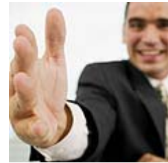
בחיפוש אחר מקום עבודה